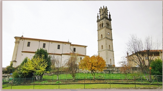
cartolina n.9 della mappa